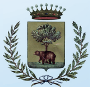
Comune di Biella